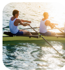
Aviron & Barque