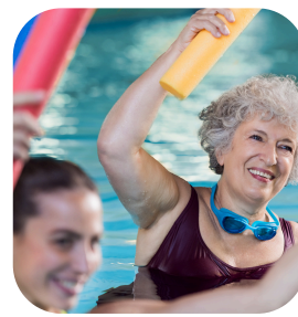
Aquagym & Natation